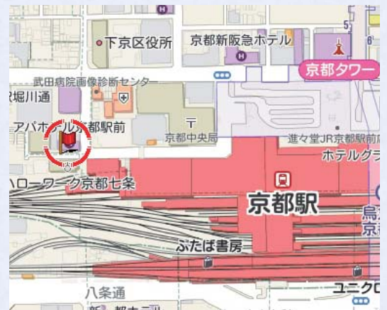
Z10LE 第 130 号 / Copyright(C)ZENRIN CO.,LTD

JR・近鉄線 JR「京都駅」烏丸中央口より徒歩3分 電車 / 新幹線「京都駅」中央出口から南北自由通路(JR西口方面)より徒歩5分 近鉄「京都駅」改札出口から南北自由通路(JR西口方面)より徒歩5分 地下鉄 / 市営地下鉄「京都駅」中央1出口より徒歩5分 車 / 名神高速道路「京都南I.C.」国道1号線沿いに車で約15分