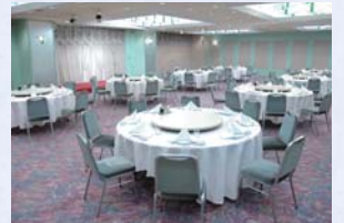
宴会場(エメラルド)

最大150名のキャパシティを持つホールから、少人数用会議室まで、大小3つのホールをご用意。