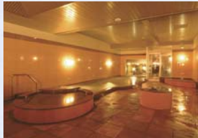
大浴殿(アパホテル&リゾート(札幌))