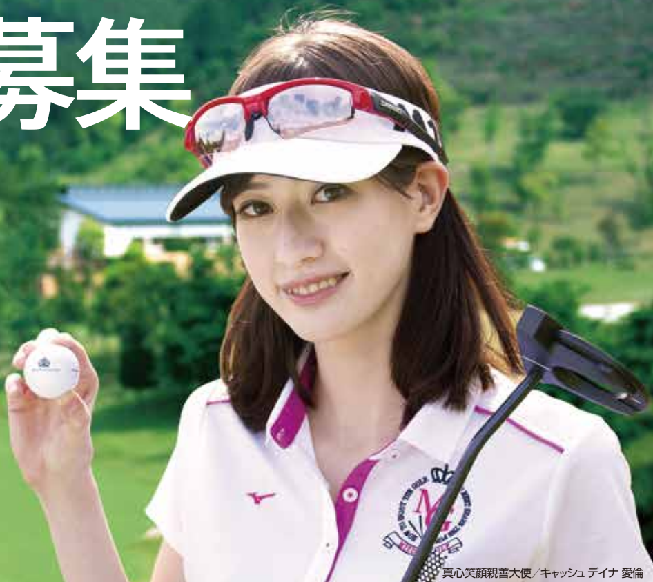
真心笑顔親善大使 / キャッシュデ INA 愛倫