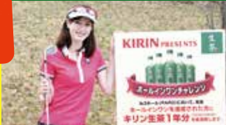
3番ホール: キリン 生茶 Present's ホールインワンチャレンジホール

特典に関する詳細についてはお問い合わせください ※1. 平日会員の土日祝はビジター料金となります。 ※2. 早期入会特典は、2018年3月末日迄にトチモクラブ年会員へご入会された方が対象となります。 ※3. 会員料金については変更になる場合がございます。詳しくは会則をご覧ください。