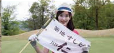
5番ホール: 築地すし好 仁 Present's イーグルチャレンジホール