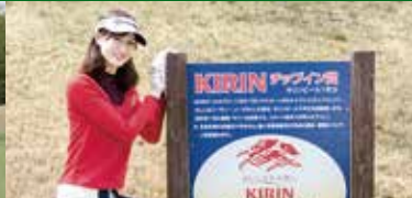
16番ホール: キリン 一番搾り Present's チップインチャレンジホール

APA RESORT <TOCHIGINOMORI G.C.> 〒328-0202 栃木県栃木市大久保町888